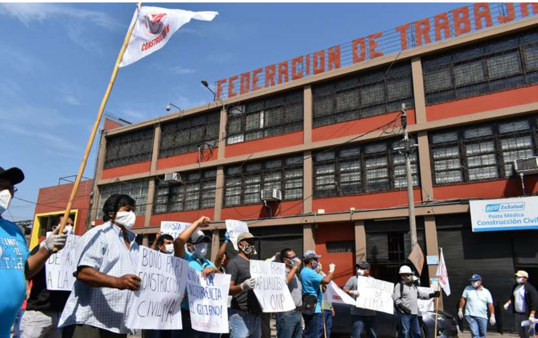
Protesta de trabajadores en construcción civil, el 30 de abril de 2020, en demanda al Gobierno del bono para construcción civil y afiliados a la ONP.