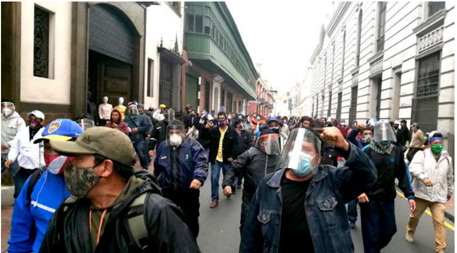
La Jornada Nacional de Lucha del 18 de agosto de 2020 se realizó con plantones en tres instituciones gubernamentales, entre ellas, el Ministerio de Economía y Finanzas.