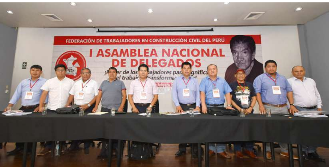
Secretariado Ejecutivo de la Federación de Trabajadores en Construcción Civil del Perú durante la I Asamblea Nacional de Delegados, el 21 y 22 de febrero de 2020.