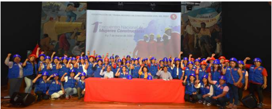
Primer Encuentro Nacional de Mujeres Constructoras. Auditorio de la FTCCP, 6 de marzo de 2020.