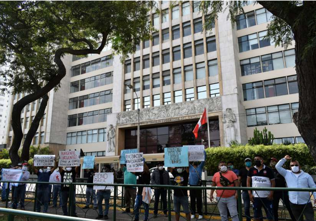
Plantón frente al Ministerio de Trabajo y Promoción del Empleo, el 6 de mayo de 2020, en demanda de reactivación de la construcción con fiscalización y bono para construcción civil.