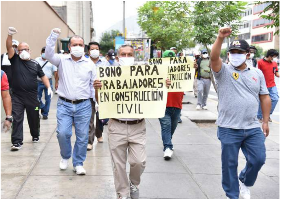
Plantón frente al Ministerio de Economía y Finanzas y posterior movilización, el 4 de mayo de 2020, en demanda del bono para construcción civil