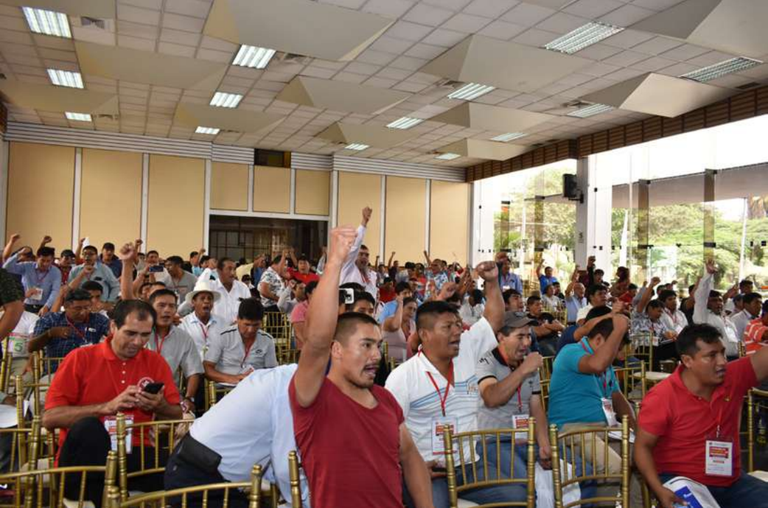
Arriba: I Asamblea Nacional de Delegados de la FTCCP, Centro Recreacional Pedro Huilca Tecse, 21 y 22 de febrero de 2020.